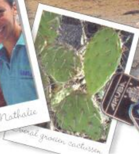
several groeien cactussen