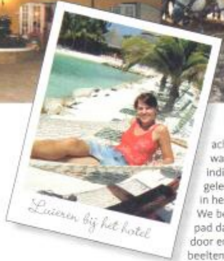
Leieren bij het hotel