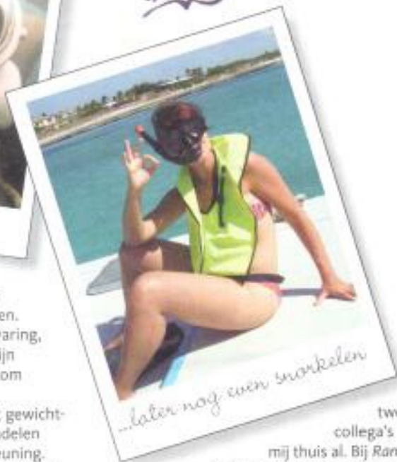
...later nog even snorkelen